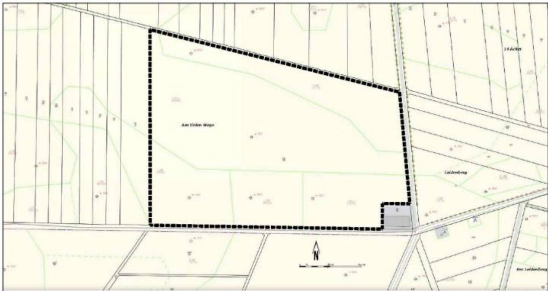
Abbildung: Geltungsbereich östlich der Ortslage Bilzingsleben; Grundlage Thüringen Viewer 02/2024 (ohne Maßstab)

Der räumliche Geltungsbereich des B-Planes befindet sich innerhalb der nachfolgenden Planskizze in der Gemarkung Bilzingsleben. Der Geltungsbereich umfasst das Flurstück 79/14, Flur 8, Gemarkung Bilzingsleben. Der Geltungsbereich hat eine Gesamtfläche von ca. 11 ha.